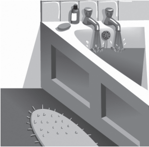
b a thr o o m

1 Completa las palabras con a, e, i, o, u.