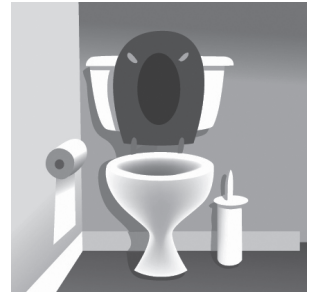
7 t _ _ l _ t

Cuál es la zona de la casa que falta? _____