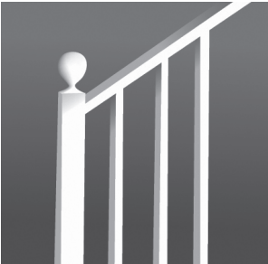
4 st _ _ rs