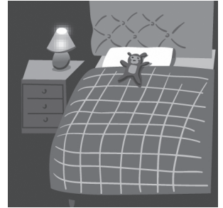
3 b _ dr _ _ m