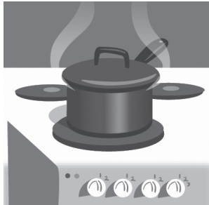
5 k _ tch _ n