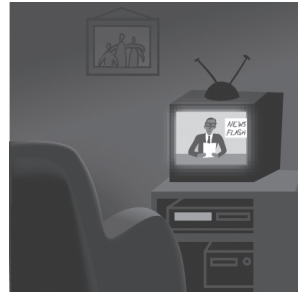
6 l _ v _ ng r _ _ m